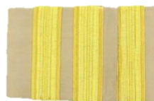
พนักงานจ้างทั่วไป