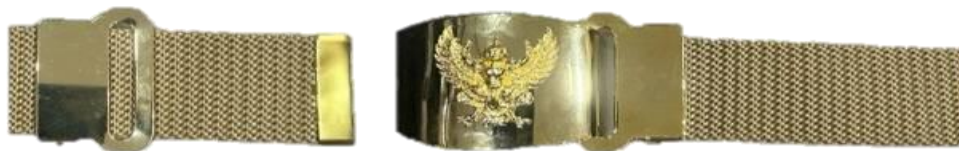
เข็มขัดแบบปลายสายออกนอก (เหมาะสำหรับผู้ชาย)