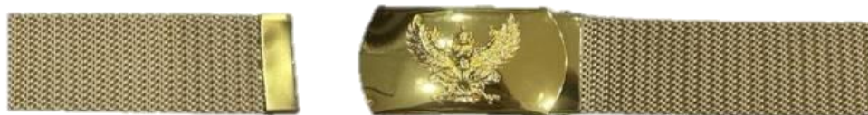
เข็มขัดแบบซ่อนปลายสาย (เหมาะสำหรับผู้หญิง)