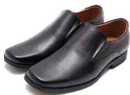
รองเท้าผู้ชาย