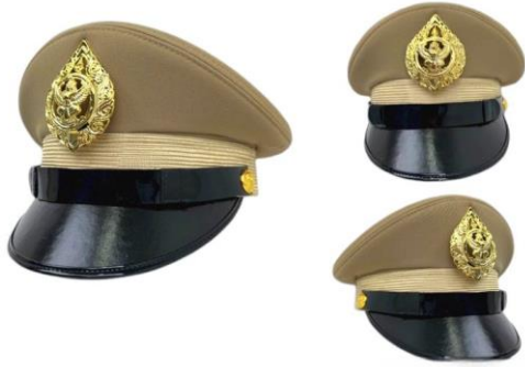
หมวกพนักงานจ้างชาย